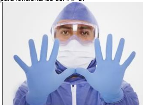
Imágenes de referencia: mascarilla, guantes, overol y gafas. Imagen 1