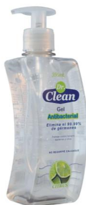
Imágenes de referencia: Posterior al lavado se debe usar gel antibacterial o alcohol antiséptico. Imagen 3