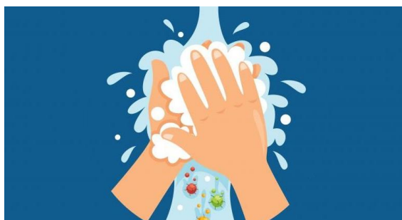
Imágenes de referencia: El lavado debe efectuarse con jabón antibacterial por un tiempo mínimo de 20 segundos por ambos lados. Imagen 2