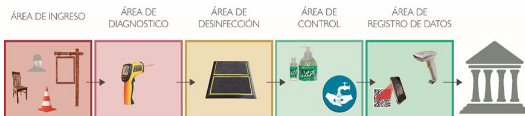
Imagen 1. Propuesta de secuencia de áreas de monitoreo sanitario y desinfección previo a ingreso a museos