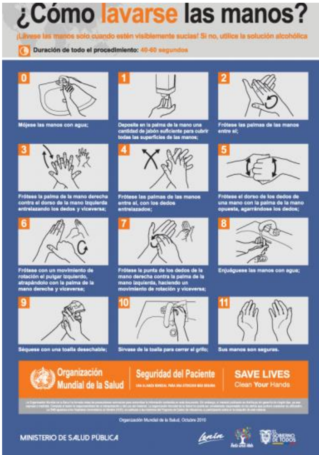
Imágenes 2. ¿Cómo lavarse las manos?